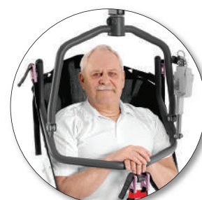
Berceau / ou 2 points