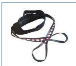
avec support supplémentaire

Deux types de ceintures de stabilisation disponibles : une version standard et une version avec support supplémentaire. Les deux se fixent à des broches latérales.