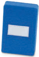
Rembourrage au niveau du coup de pied