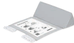
Cale de positionnement