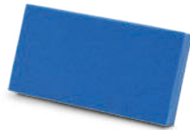
Rembourrage en mousse supplémentaire